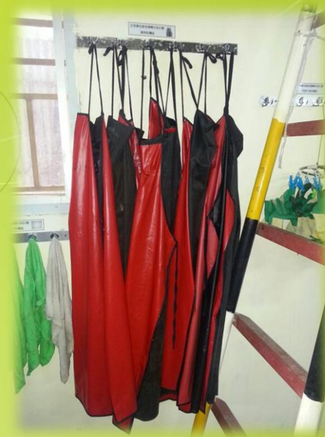
工具清潔及晾曬位置