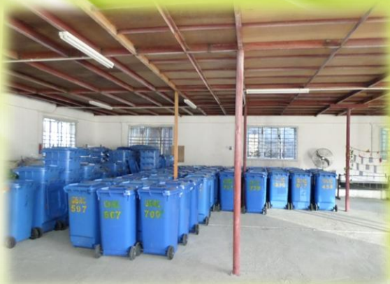
玻璃樽回收工作站