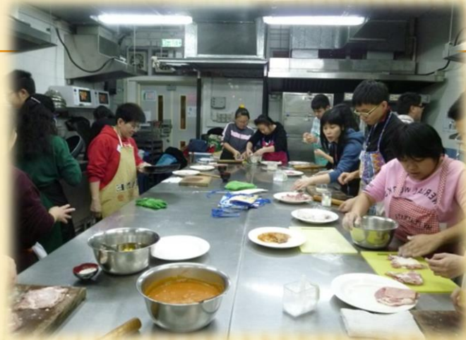
西式餐飲文憑課程