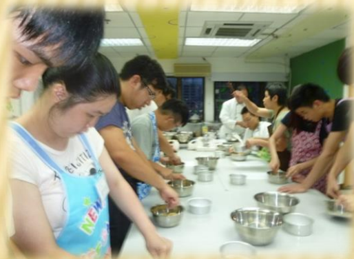
烘焙製作文憑課程