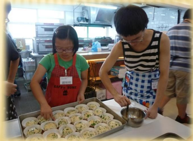
麵包製作文憑課程