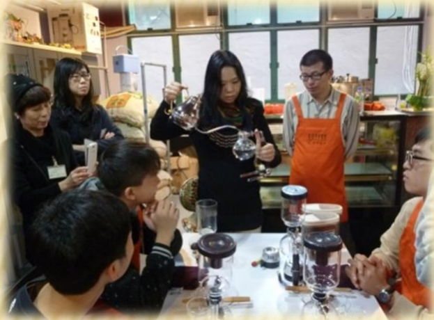
咖啡沖調文憑課程