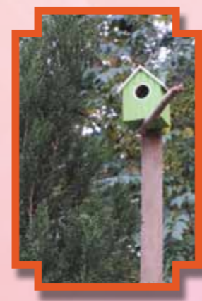
「草花鳥舍」- 座地的仿古金屬鳥舍，將飼養一對情侶鸚鵡，閒時吱吱叫喚，充滿生氣。學員更負責鸚鵡的日常照料工作，培養責任心，而四面地方種有蒲草，當中植有百日草、白蘭樹和柏樹，製造出天然日陰，可供學員席地而坐或躺睡望天，以調適情緒，解悶舒壓。樹上的細小鳥舍，可供學員觀鳥及教導學員保育知識