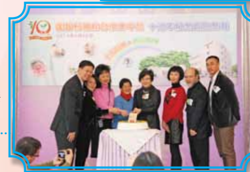
眾嘉賓為感恩聚餐進行切餅儀式