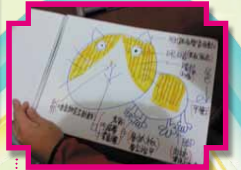
舍友利用他們親手繪製之「貓咪介紹簿」，將「家家」、「樂樂」介紹給其他舍友及中心同工認識