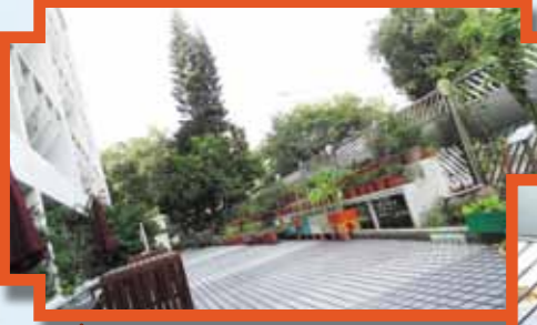
「感官長廊」- 供不同類別殘障人士使用的多類型園藝活動操作空間，是中心主要的園藝及五感治療活動區

匡智粉嶺綜合復康中心的療癒花園，取名「感動療園」，花園共分為十個不同主題活動區，採用「以人為本」的需要評估和能力考量，為不同程度的殘障/智障服務使用者，設計「度身訂造」的園藝治療活動，用以改善受助者的身體、社交、情緒、認知或工作等五個方面的能力及改善個人福祉。以下介紹各項園藝及動物治療設置：