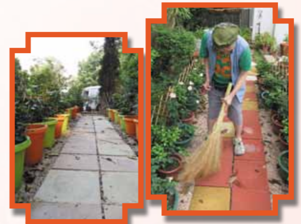
「香花步道」- 感受香花香草的香味，滿足視覺與嗅覺的感官刺激。由服務使用者擔任日常花草照料工作，採收香草作食用及其它工藝用途，培養他們責任心、耐性及工作技能