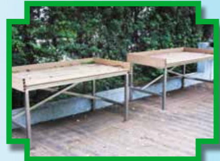
供坐輪椅學員使用的戶外檯椅