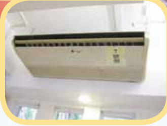
(3)更換中心部份性能開始衰退的冷暖氣機，讓服務使用者全年均在合適的溫度下生活