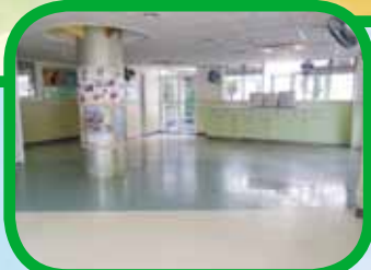
(4)更換部份地方膠地氈，保持中心環境清潔、光潔及明亮