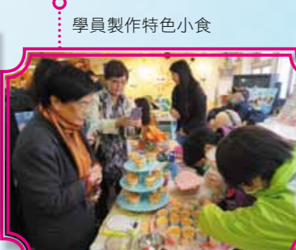
學員製作特色小食