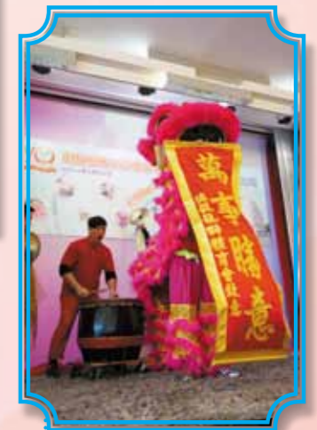
學員聯同義工隊表演舞獅助慶，祝賀到場人士萬事如意