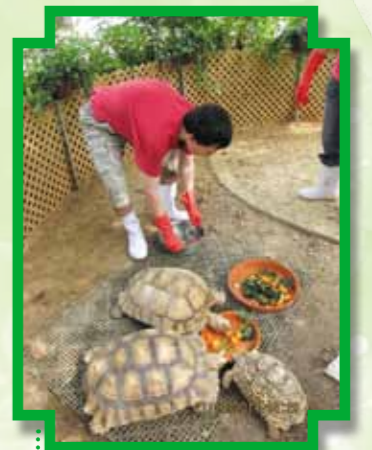
學員成為龜龜保育員

從觀察中發現，學員對不同種類的動物有不同反應和互動，為此，中心除飼養貓外，亦開始飼養不同種類的動物，如：盾臂陸龜、巴西龜、錦鯉魚和狗等。從而將本中心打造成一「人與動物互愛的感動家園」。亦藉著培養智障人士成為動物大使，將愛護動物、珍惜生命的訊息傳遞於社區中。