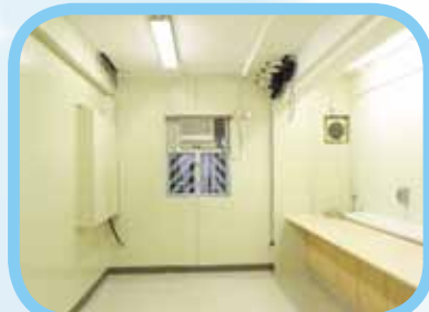
(5)改裝D102工程 D102進行改裝工程，發展成為展藝廊，培養學員發展藝術工作