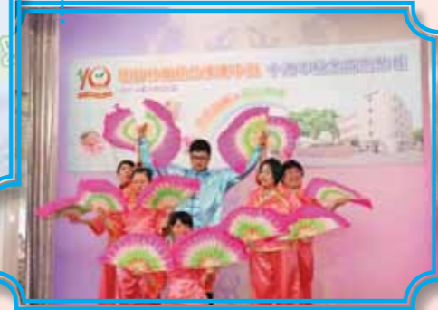
匡智地區支援中心-新界北區學員表演羽扇舞，展現藝術潛能