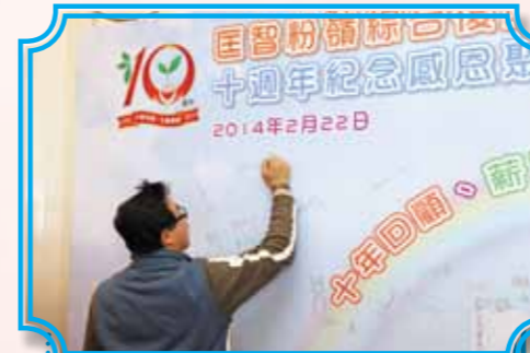
會場設立了大型簽名紀念版，給到場人士簽名及拍照留念，分享中心十年來的喜悅

「十年回顧、薪火相傳」感恩聚餐於2014年2月22日假座Mega Box御苑皇宴園景閣舉行。適逢新春時節，學員扮演的財神大派利事及扮演小丑祝賀到場人士。當日表演項目十分豐富，各人看得津津樂道。藉此機會，中心頒發了「最感人心聲分享」、「祝福寄語大募集」予得獎同工，以及「十年服務獎」予中心服務十載之同工，彰顯同工們辛勞工作及竭誠為智障人士服務。