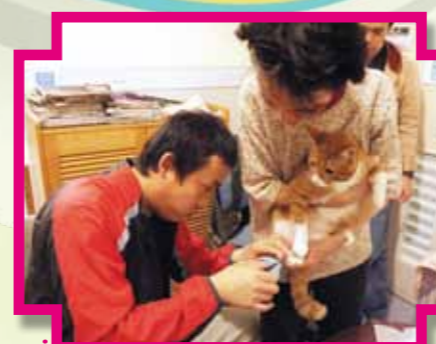
在義工指導下，舍友們學習為小貓剪指甲(左)及製作紙箱屋(右)

「家家」及「樂樂」由3位居於輔助宿舍舍友全力照顧，透過香港動物治療基金會的義工協助，培訓他們成為動物大使，由過往「被照顧」成為今天兩隻小貓的「照顧者」，照顧小貓日常起居飲食，從而培養他們責任感及提昇自信。