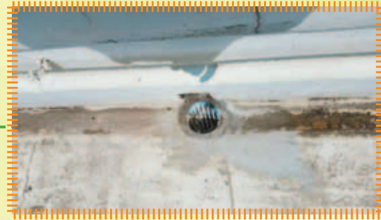
翻新5樓天台去水設施，改善去水情況