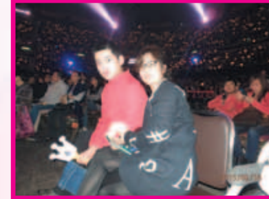
譚校長的歌聲令全場都好投入