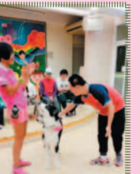
在青年義工指導下，學員溫柔地撫摸狗隻，得到義工拍掌鼓勵