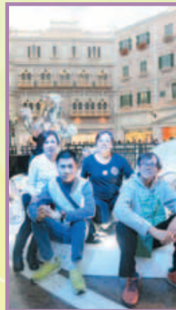
我們到威尼斯人一遊