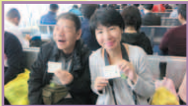
杜喜第一次出發去澳門，太興奮喇