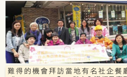
難得的機會拜訪當地有名社企餐廳“Swan Bakery”，與店內導師及實習生交流，也品嚐了他們美味的出品。