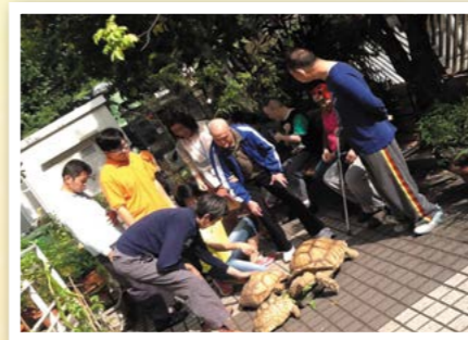
學員在戶外與龜散步玩樂。