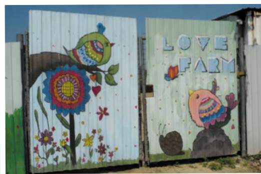
由學生為「愛心農田」門口繪畫的圖案。