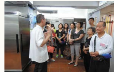
參觀社企中央廚房。

「服務推廣巡禮2015」於2015-16年度6月至9月期間展開，參與人數高達110人，當中服務使用者、家長及轉介者佔活動參與人數超過80%。透過是次巡禮，參加者均表示對就業服務的內涵、工種選擇以及僱主的期望等有更深的了解。另外，由2016年1月起，凡過去曾參加「殘疾人士在職培訓計劃」及「陽光路上培訓計劃」，並已完成服務的服務使用者，如在就業上有需要可再次向機構提出申請，重新加入服務。