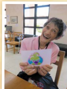
學員對自畫圖畫非常滿意。