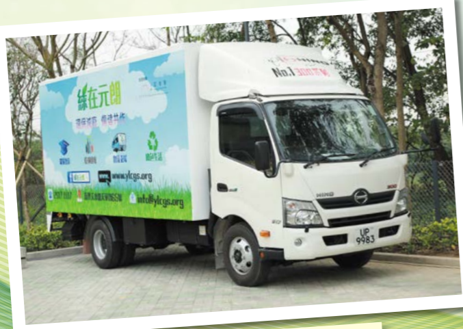
回收專車為元朗區提供回收支援服務。

「綠在元朗」已於12月5日起開始營運，除了會到元朗區各屋苑及機構進行回收工作外，項目將同時舉辦不同形式的環保教育活動，推廣「惜物、減廢」和「乾淨回收」的信息，令綠色生活紮根社區。而有關回收及環保教育活動、在元朗區不同地方擺設街站回收物品、義工招募等工作已陸續展開。計劃同時會為匡智學員提供職前訓練的機會，讓他們有機會與社區人士相互溝通，展現他們的工作能力。