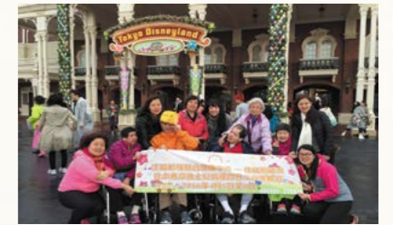
雖然下雨，也無礙我們在迪士尼樂園的興緻。