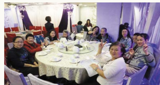
一同外出飲茶及參觀博物館。