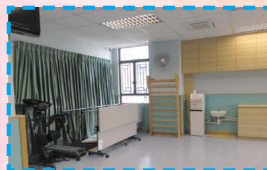
提供治療服務的一角。