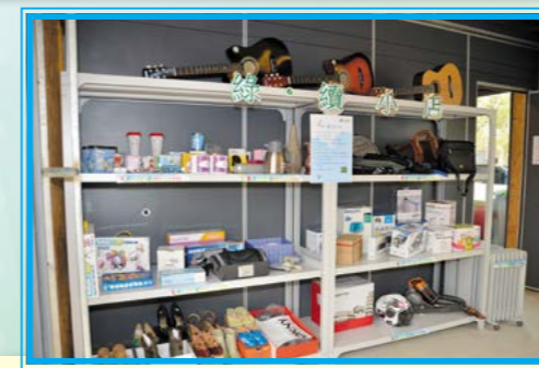
「綠·續小店」內有漂書閣及各款回收日用品，讓有需要的元朗區市民到店內換取。