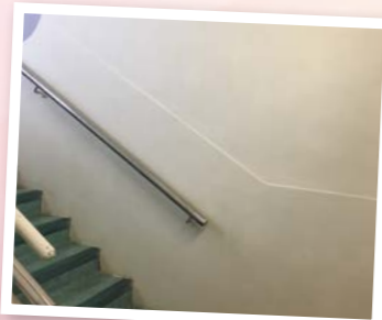
批灰及油漆工程 - 樓梯、天台水缸