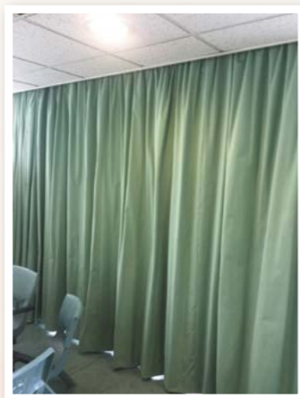
更換及安裝日間展能中心各房間窗簾