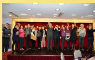
潘先生、嚴院長及各部門主管在台上舉杯祝酒。