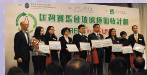
環境局局長黃錦星先生，GBS, JP(左一)頒發「最高回收量」的十間得獎機構。