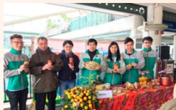
同工與學員參與年桔回收計劃。