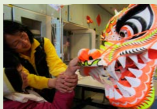
金龍與學員同工零距離接觸。

在短短過去一年間，年桔繁殖長成並吸引為數不少蝴蝶到來，在樹上產卵孵出幼蟲，令院友們能親身目睹由蝴蝶化蛹至破殼羽化的過程，整個孵化過程讓院友們既興奮又緊張。中心將繼續支持年桔回收計劃，讓中心學員可透過觀察蝴蝶的日常生態，學習欣賞大自然的美麗。