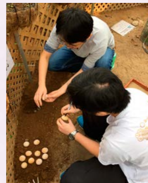
員工細心為每隻龜蛋紀號。