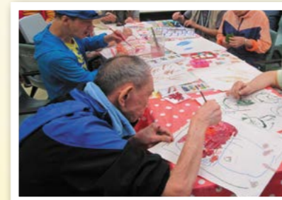
回到兒時齊齊畫畫。