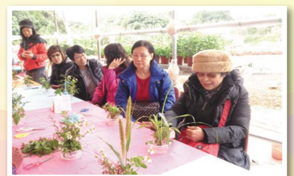
參加者分享用自己製作的雜草劍山來比喻自己的人生。