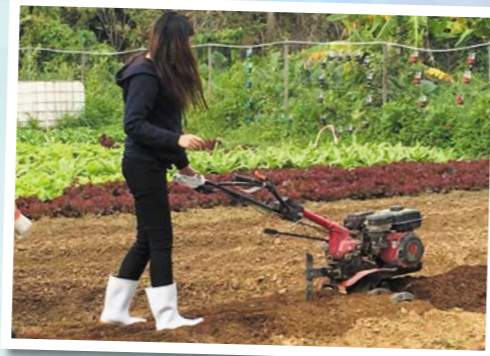
平日文靜的女同學，在學習使用翻土機時，似模似樣。