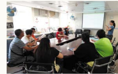
了解陽光路上在職培訓計劃。