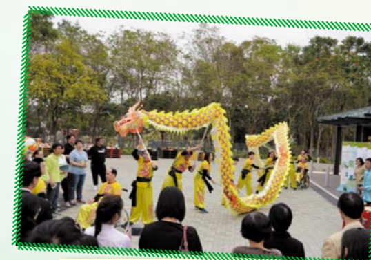
匡智粉嶺綜合復康中心傷健舞龍隊為「綠在元朗」開幕典禮舞龍助慶，展現傷健共融的精神。