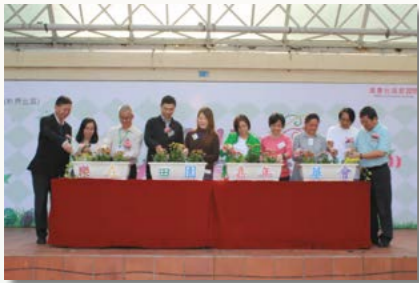
社區環保嘉年華會-各嘉賓於台上作活動啟動禮。

2015年11月在祥華邨遊樂場舉行了一次大型社區環保嘉年華會，是次活動吸引了500多位社區人士及義工參與，藉以宣傳「樂在田園惠社群計劃」，有助推動日後相關活動的機會。