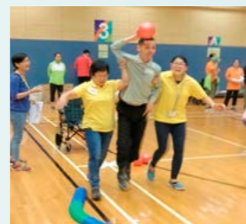
護理院學員及職員，投入比賽。

專業治療部與綜合服務部合辦《活在牆外》，是針對自閉症服務使用者的感覺統合需要而設計的一系列活動，當中包括揸水慈善步行、水療活動、單車同遊、行山的體驗和農場的活動。內容以大自然中的感覺為基調，著重感官體驗的過程，滿足服務使用者視覺、聽覺、觸覺與本體覺等各方面不同的感官需要，讓他們在大自然環境中，體驗自主與自決，並留下燦爛的笑容。