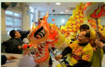
舞龍隊隊員盡情演出。