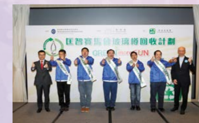
五位匡智會學員獲委任成為「乾淨回收先鋒」，肩負推動社區人士建立乾淨回收的使命。