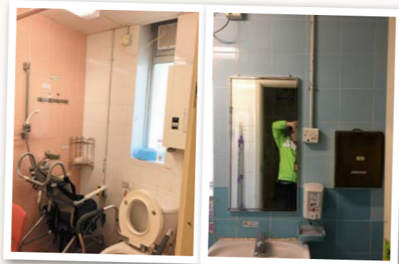
修葺B310及D205洗手間瓷磚