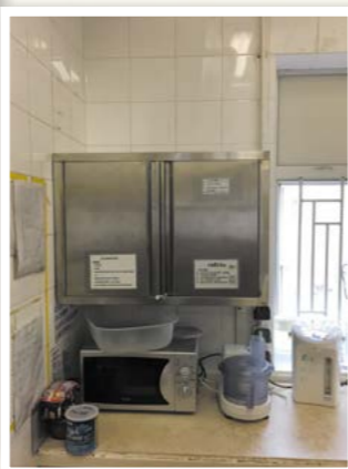
B314茶水間不鏽鋼儲物櫃