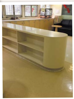
A座地下部份翻新工程